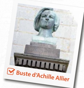
Buste d'Achille Allier